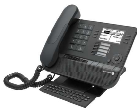
8029 Premium DeskPhone

Comunicaciones innovadoras, centradas en el cliente y rentables para pequeñas empresas.