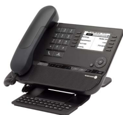
8039 Premium DeskPhone